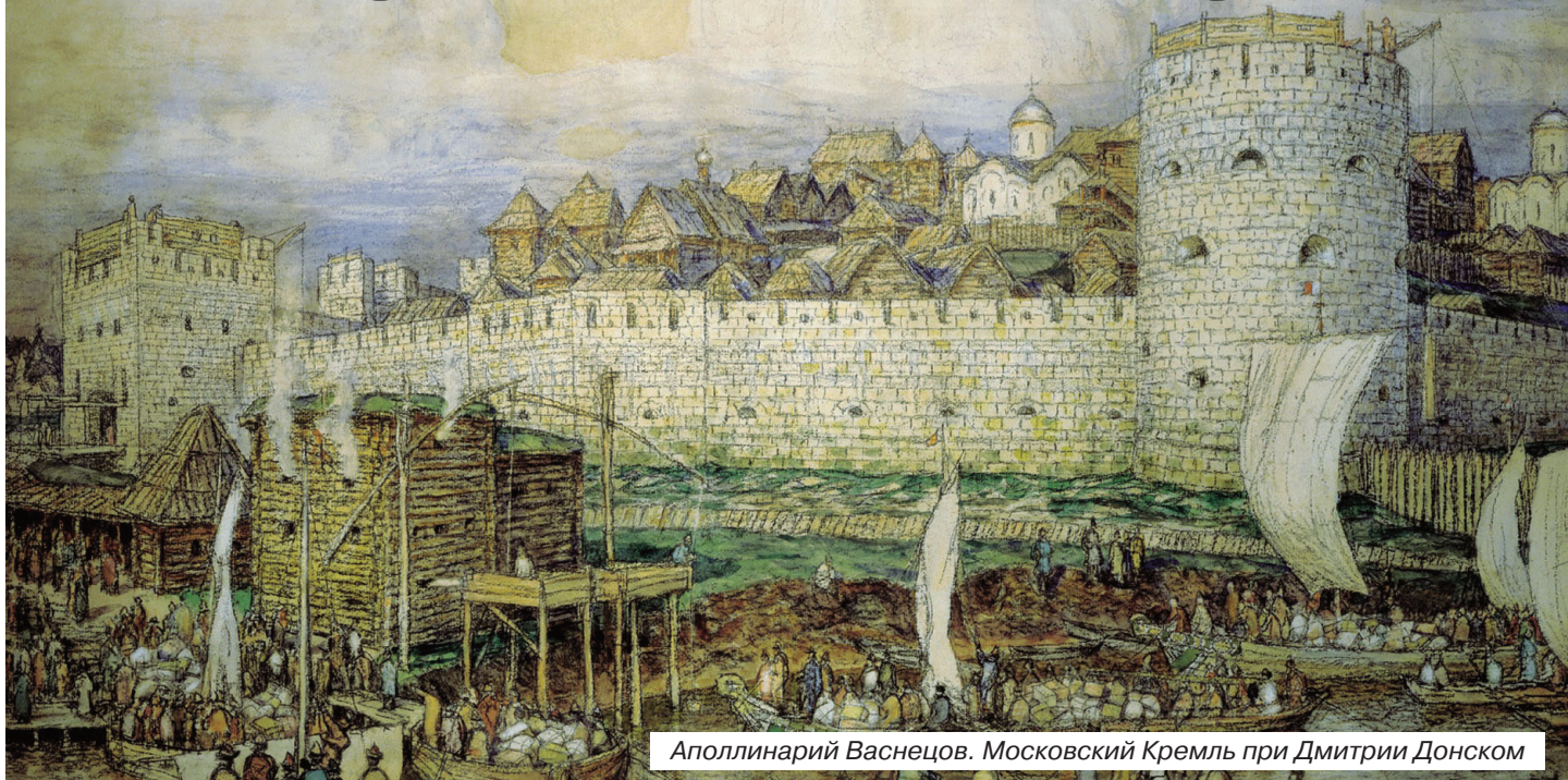
Аполлинарий Васнецов. Московский Кремль при Дмитрие Донском

Именно так назвал в годы войны партийных чиновников И. Сталин, узнав, что после эвакуации из Москвы в Куйбышев, они создали в запасной столице отдельную, элитную школу для своих детей. История России – это извечная борьба лидеров страны с боярским окружением, начиная от противостояния Андрея Боголюбского с боярами-заговорщиками, Ивана Грозного - с боярами-предателями, Сталина, отравленного своим окружением, и, заканчивая партийной советской элитой, напуганной правлением Андропова, и пошедшей на ликвидацию партийного контроля и развал СССР.