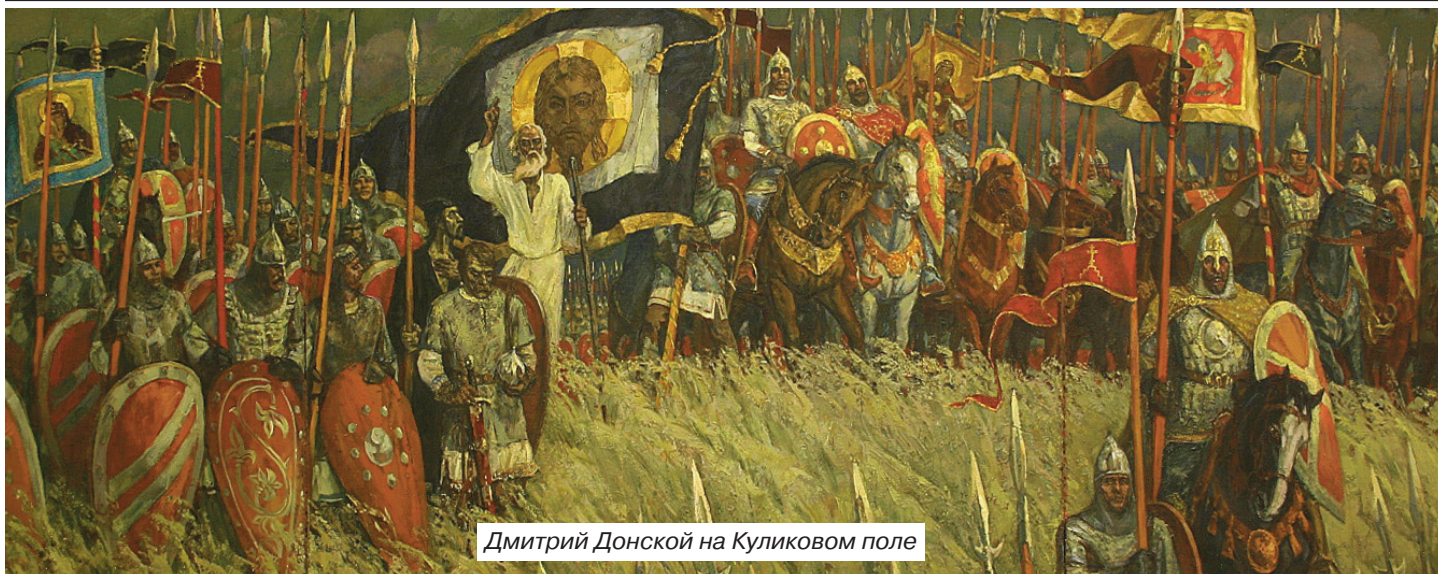
Дмитрий Донской на Куликовом поле